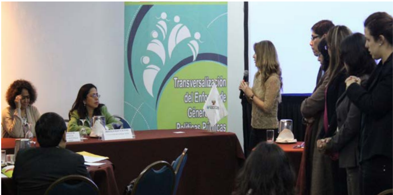
Reunión de Trabajo con la Alta Dirección de DEVIDA sobre políticas públicas para la igualdad de género

La experiencia de implementación de esta nueva competencia del sector ha sido enriquecedora y, en este proceso se ha logrado articular mejor el trabajo intergubernamental y el rol rector del MIMP. Con la satisfacción propia de los avances reseñados, para el 2014 se renueva el compromiso de continuación de esta línea estratégica de trabajo sectorial para su consolidación ■