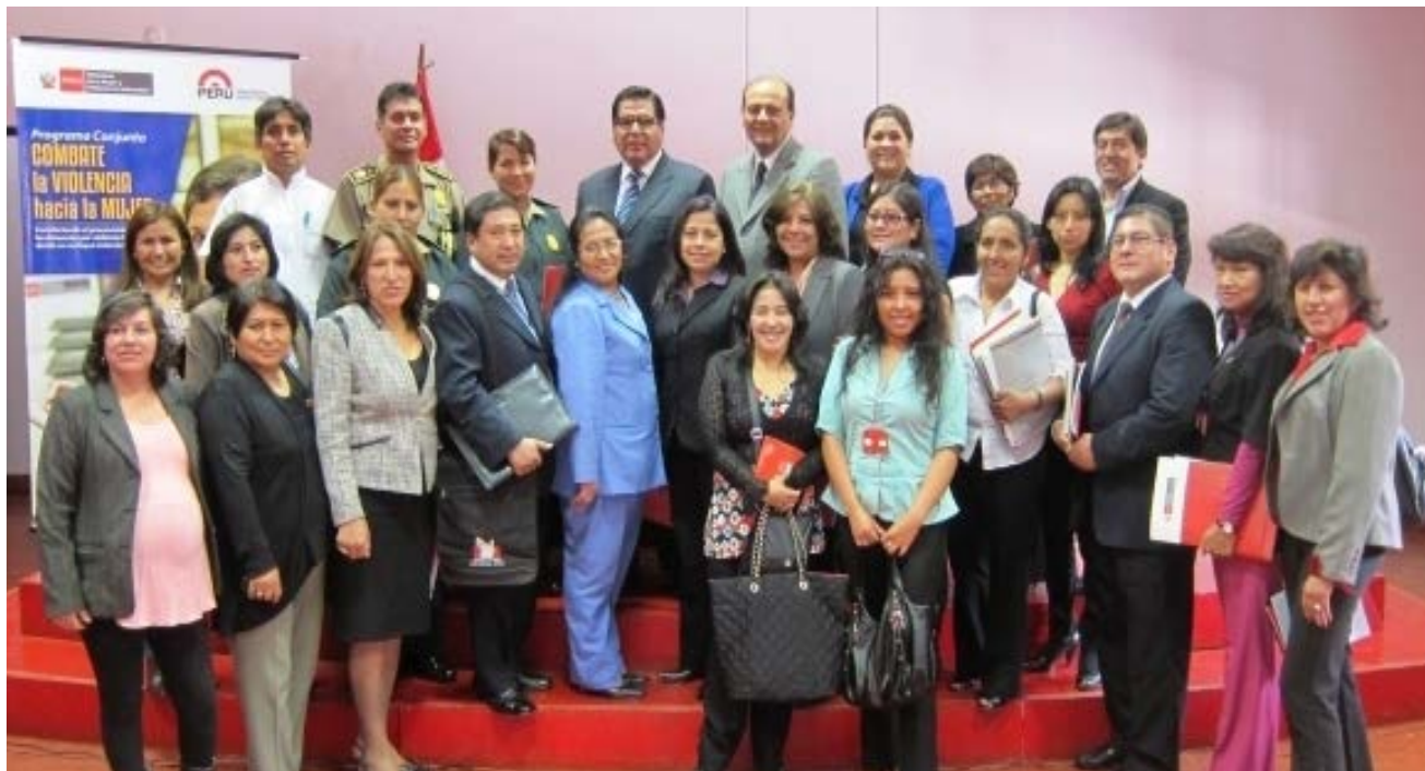
Programa Conjunto Combate la Violencia hacia la Mujer 3 de Octubre Ayacucho

El Ministerio de la Mujer y Poblaciones Vulnerables es el ente rector en políticas públicas nacionales y sectoriales contra la violencia de género. Tiene la facultad de intervenir a nivel nacional en todo el ciclo de las políticas públicas, fortaleciendo la relación intergubernamental en términos de cooperación, coordinación y colaboración 1 , e impulsa la alineación de las políticas nacionales con las políticas regionales y locales con la finalidad de mejorar la atención y la prestación de servicios a la ciudadanía.