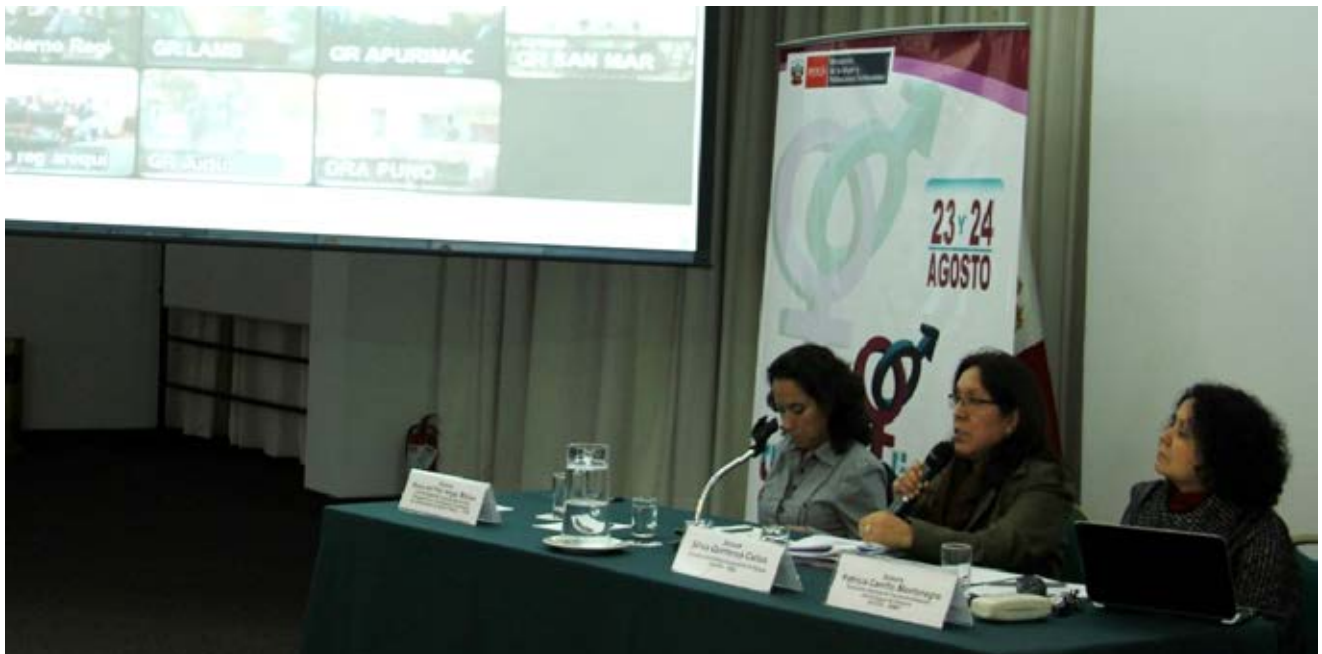
Video conferencia con Gobiernos Regionales sobre Transversalización del enfoque de género en las políticas y la gestión regional

La transversalización del enfoque de género en las políticas públicas: Un proceso que avanza con el compromiso de las autoridades, funcionariado y especialistas de las entidades públicas