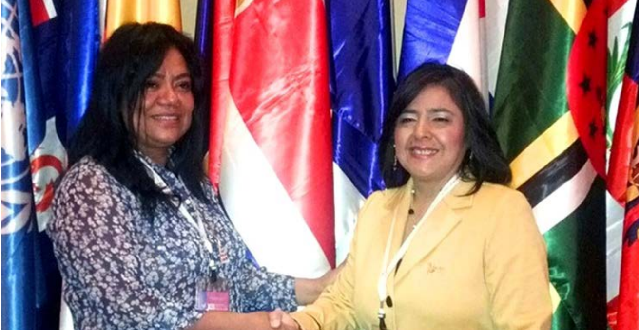
XII Reunión del Consejo Asesor Andino de Altas Autoridades de la Mujer e Igualdad de Género (CAAAMI) de la Comunidad Andina

D urante el año 2013, el Ministerio de la Mujer y Poblaciones Vulnerables ha fortalecido su proyección internacional participando en varios eventos encaminados a generar consenso internacional para la promoción y protección de los derechos de las mujeres.