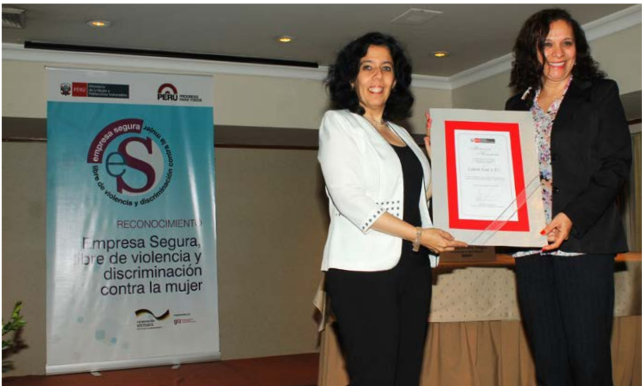
“Sello empresa segura libre de violencia y discriminación contra la mujer” 4 de Diciembre de 2013, Lima

Por último, en el marco de las facultades normativas del MIMP, se han institucionalizado medidas de prevención y afronte del Síndrome de Agotamiento Profesional a través de lineamientos específicos que han sido construidos con las/os operadoras/es de diversos servicios de forma participativa y consensuada ■