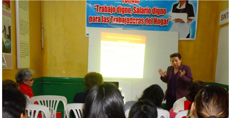
Organizaciones de Trabajadoras del Hogar SINTTRAHOGARP y SINTRAHOL

En las trabajadoras del hogar confluyen una serie de vulnerabilidades: la situación de pobreza, el origen étnico, la corta edad, la carencia de lazos familiares cercanos, y el aislamiento por la naturaleza de la actividad que se desarrolla al interior de un grupo familiar que no es el propio. Estos factores las exponen a un alto riesgo de sufrir diversos tipos de violencia. La violencia sexual es una de ellas, la misma que se expresa en hostigamiento sexual y hasta en violaciones por parte del empleador o de algún miembro de la familia. En muchos casos, estos hechos no son denunciados, por vergüenza, temor y por el riesgo de la pérdida del trabajo, su única