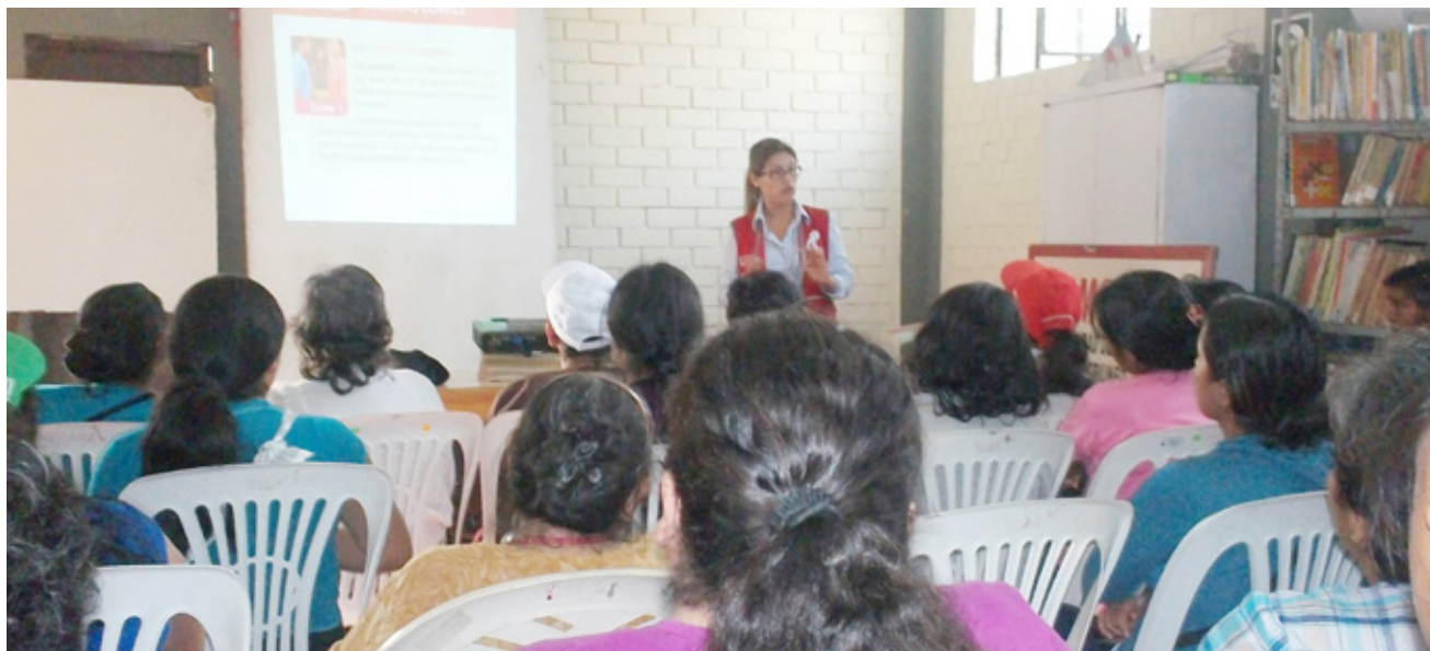
Intervenciones dirigidas a 25 trabajadoras del hogar por sesión

En el marco del Día Internacional de la Mujer y del Día Internacional de las Trabajadoras del Hogar, destaca el trabajo iniciado a mediados de 2013 por la Unidad de Prevención y Promoción de una Vida Libre de Violencia (UPPIFVFS) del Programa Nacional contra la Violencia Familiar y Sexual. La propuesta de trabajo “Vida y Trabajo sin violencia” consiste en acciones de sensibilización, capacitación, prevención y promoción dirigidas a trabajadoras del hogar con el objetivo de fomentar capacidades y habilidades personales de empoderamiento para prevenir la violencia familiar y sexual en su entorno.