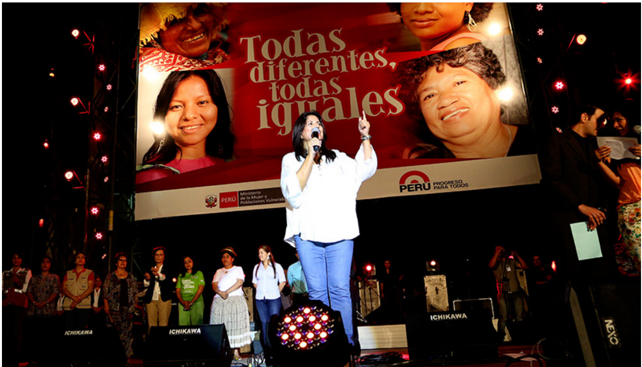
Serenata por el Día de la Mujer en el Parque de la Exposición - 7 de marzo

En este mes de marzo, en que hemos conmemorado el “Día Internacional de la Mujer”, debemos reflexionar en torno a la situación de las mujeres peruanas y la problemática que enfrentan, día a día, en la búsqueda de su completa ciudadanía e inclusión social, influida por factores externos a ellas como su origen étnico racial y cultural, su procedencia o su nivel educativo, entre otros.