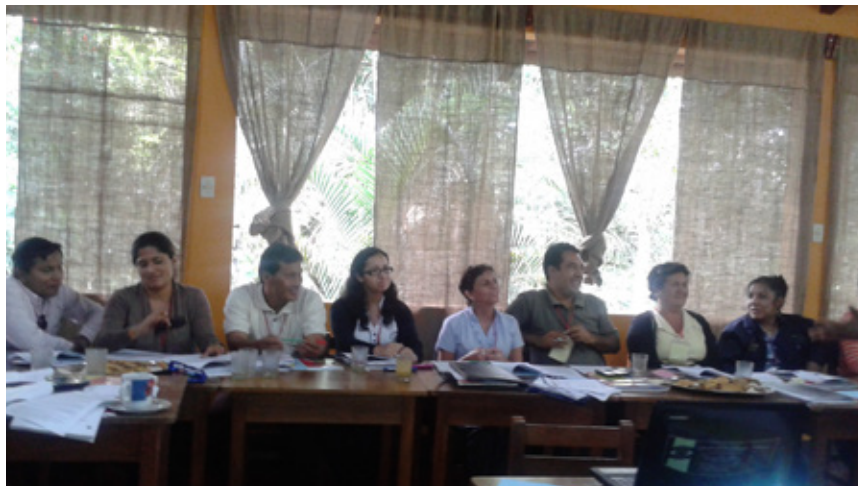
Asistencia técnica en el Gobierno Regional de San Martín - Febrero.

En 2014, esta institución ha desarrollado diversas acciones para fortalecer sus capacidades institucionales para la transversalización del enfoque de género en sus políticas,