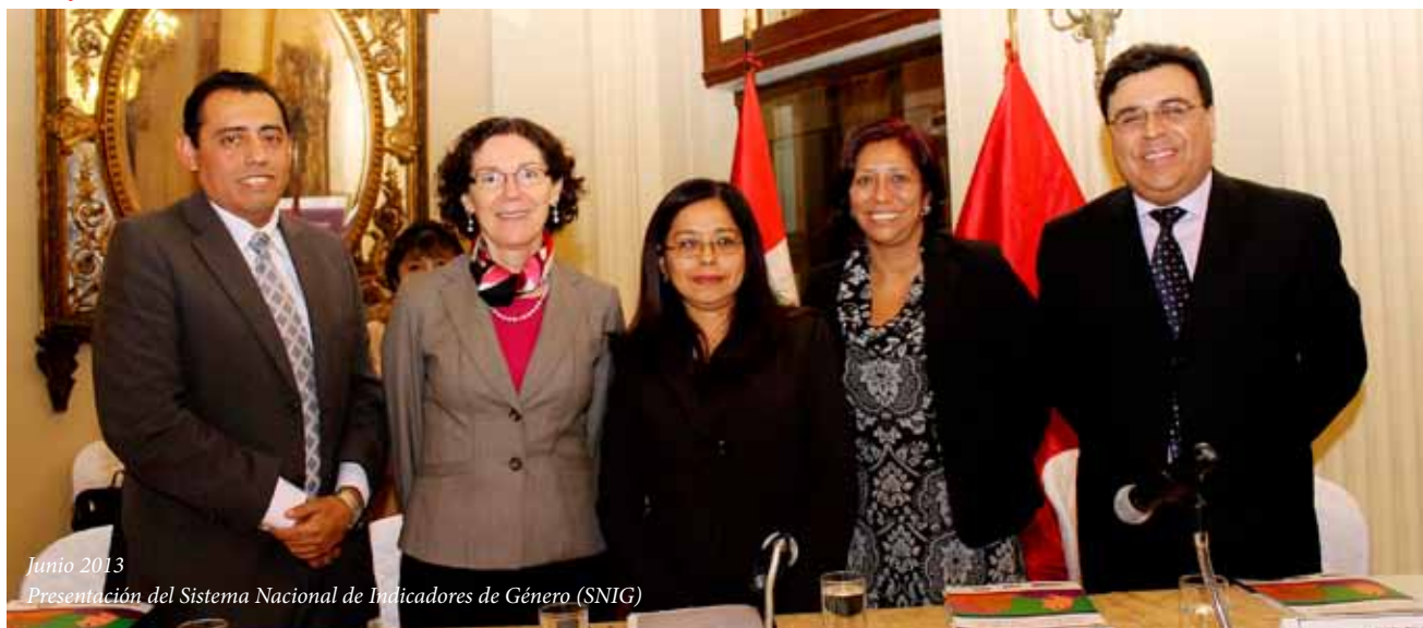
Junio 2013 Presentación del Sistema Nacional de Indicadores de Género (SNIG)