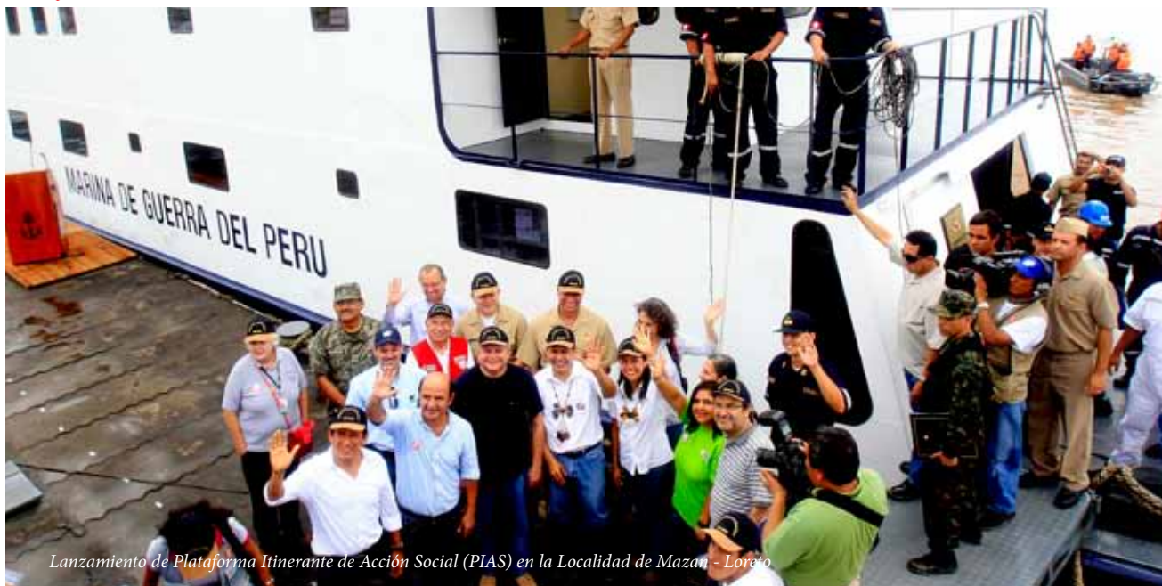
Lanzamiento de Plataforma Itinerante de Acción Social (PIAS) en la Localidad de Mazan - Loreto