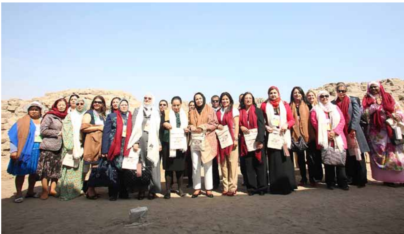
MUJERES LÍDERES DE LOS PAÍSES ASPA, mujeres líderes transformando el mundo