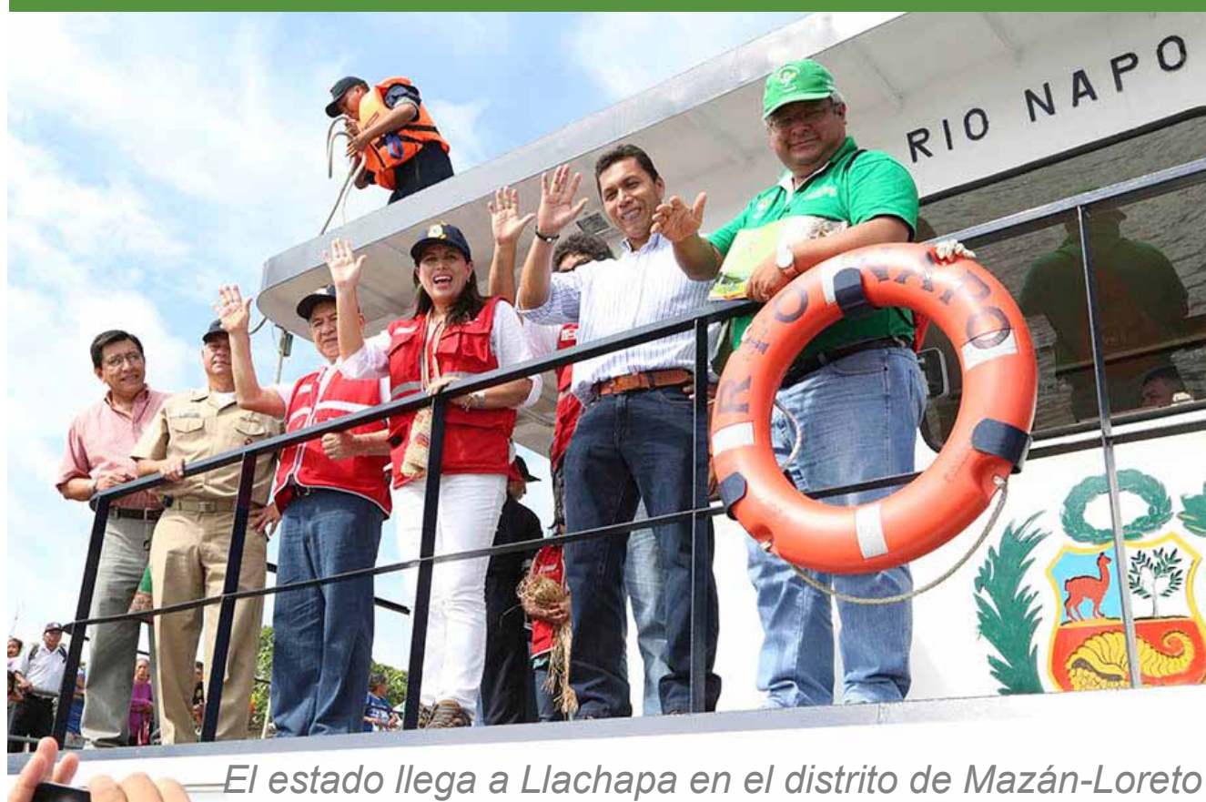
El estado llega a Llachapa en el distrito de Mazán-Loreto

Hasta abril del 2014, han participado en el plan 23 poblados de la cuenca del Napo correspondientes a los distritos de Torres Causana, Napo y Mazán, incluyendo los poblados de Santa Martina y Mazán, capital del distrito.