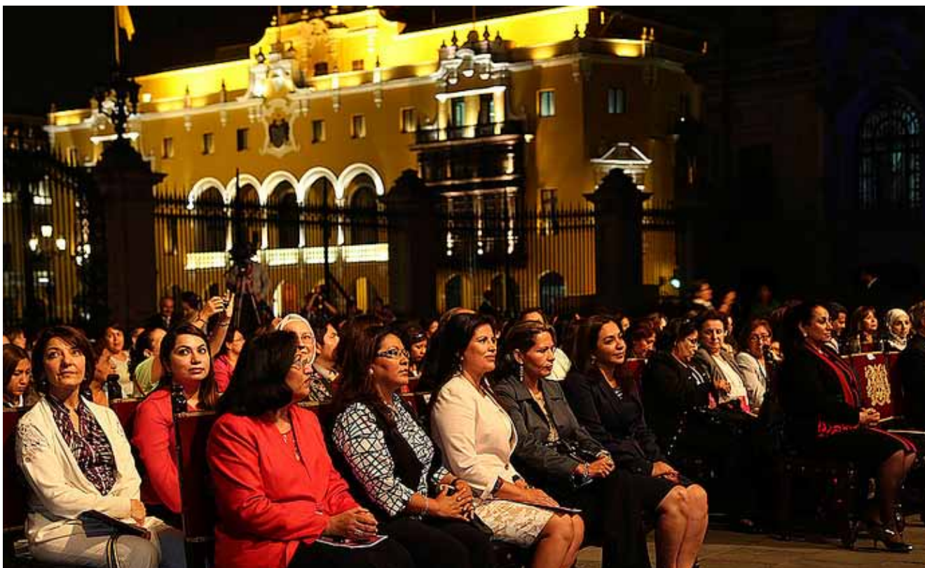
Carmen Omonte, Ministra de la Mujer y Poblaciones Vulnerables en medio de lideresas árabes-suramericanas