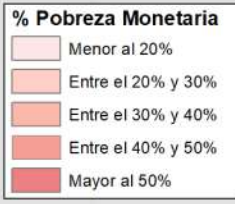
MAPA DE POBREZA PROVINCIAL