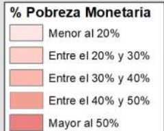
MAPA DE POBREZA PROVINCIAL