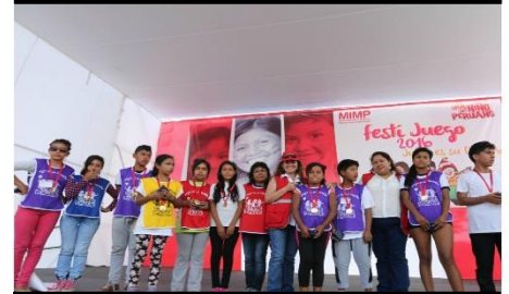
Ganadoras/es lucieron sus medallas con orgullo