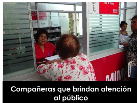
Compañeras que brindan atención al público