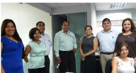
Gabinete de Asesores