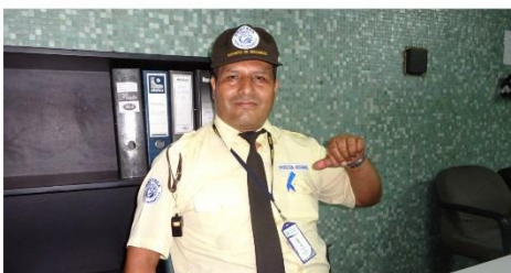
Seguridad del S1