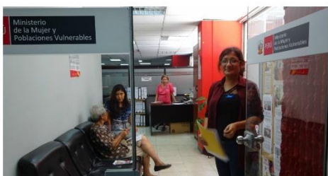
Dirección del Adulto Mayor