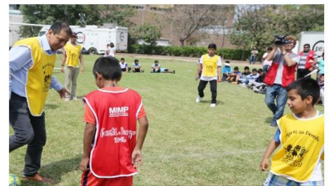
Ministro de Trabajo jugó "Fulbito" con los niños