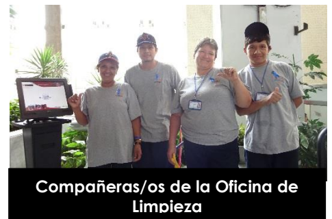
Compañeras/os de la Oficina de Limpieza