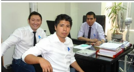
Dirección de OTI