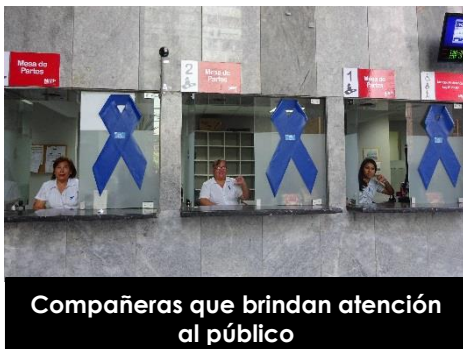
Compañeras que brindan atención al público