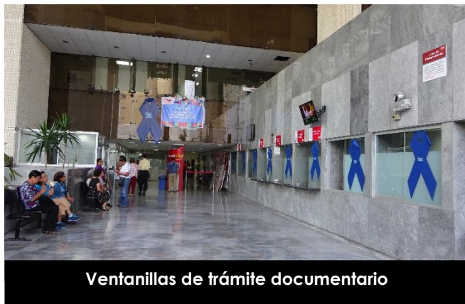
Ventanillas de trámite documentario

Muchas personas nos consultaron sobre qué es concienciación, otras amablemente “nos alertaron” que nos habíamos equivocado cuando leyeron las banderolas sobre el “Día de la Concienciación sobre las Personas con Autismo” y nos dimos cuenta que era necesario dar una explicación: Concienciación es “crear conciencia entre la gente acerca de un problema o fenómeno que se juzga importante”. Y el autismo es uno de ellos. Por ello, el MIMP conmemoró el 2 de abril el Día Mundial de Concienciación sobre las personas con Autismo y todo el personal del MIMP se unió a esta causa portando un simbólico lazo azul en referencia a la fecha, igual al que se usó para ambientar la institución con el objetivo de sensibilizar al público interno y externo así como contribuir a crear las mejores condiciones posibles para las personas con Autismo. Reconocer su talento es esencial para crear una sociedad con valores.