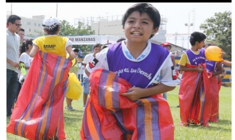
Competencia de "Encostalados"