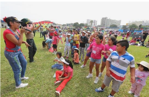
"Las Politas" de la PNP cantaron y bailaron con los infantes