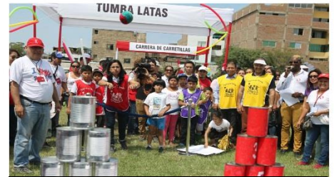
Ministra de la Mujer participó en Juego "Tumba Latas"