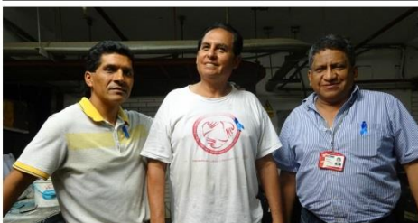
Oficina de Servicios Generales