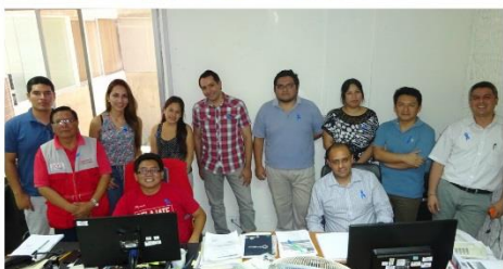
Oficina de OTI