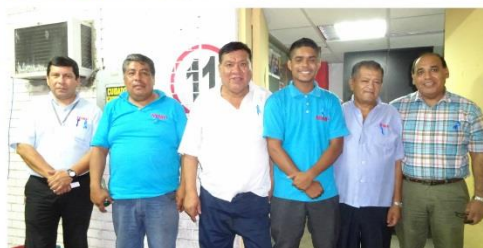
Oficina de Transportes