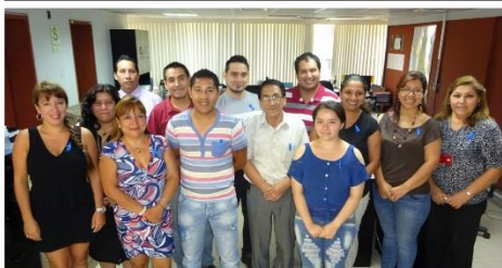
Dirección de Beneficencia Pública