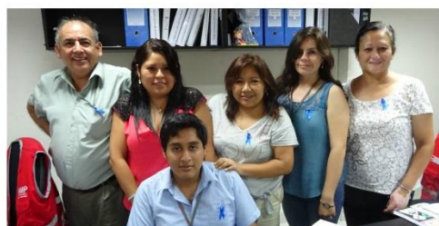
Dirección de Investigación Tutelar