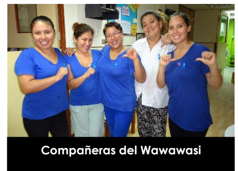
Compañeras del Wawawasi