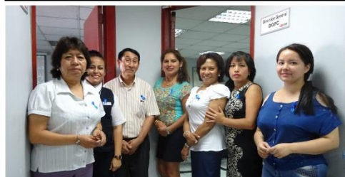
DG de la Familia y Comunidad