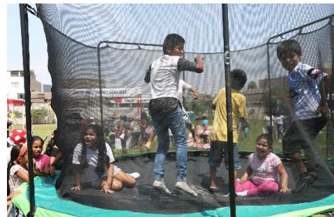
Juegos al aire libre