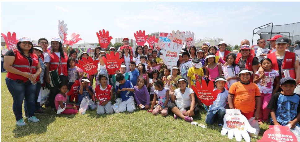
Niñas y niños de los Programas Nacionales del MIMP celebrando su día

MIMP organizó el "Festijuego 2016: Jugar es un derecho" en conmemoración del Día de la Niñez peruana en donde se realizaron 15 competencias deportivas, concurso de barras y variados juegos libres. Congregando a más de un millar de infantes y adolescentes de los diferentes Programas Nacionales: YACHAY, CONTIGO, Dirección de Investigación Tutelar (DIT) e INABIF. Y de otras instituciones como