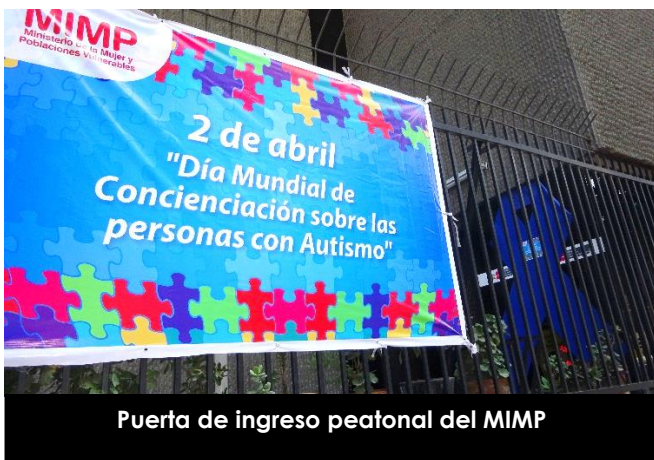
Puerta de ingreso peatonal del MIMP

Muchas personas nos consultaron sobre qué es concienciación, otras amablemente “nos alertaron” que nos habíamos equivocado cuando leyeron las banderolas sobre el “Día de la Concienciación sobre las Personas con Autismo” y nos dimos cuenta que era necesario dar una explicación: Concienciación es “crear conciencia entre la gente acerca de un problema o fenómeno que se juzga importante”. Y el autismo es uno de ellos. Por ello, el MIMP conmemoró el 2 de abril el Día Mundial de Concienciación sobre las personas con Autismo y todo el personal del MIMP se unió a esta causa portando un simbólico lazo azul en referencia a la fecha, igual al que se usó para ambientar la institución con el objetivo de sensibilizar al público interno y externo así como contribuir a crear las mejores condiciones posibles para las personas con Autismo. Reconocer su talento es esencial para crear una sociedad con valores.