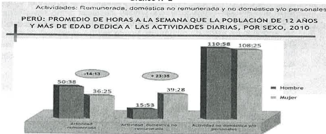
Gráfico N° 2