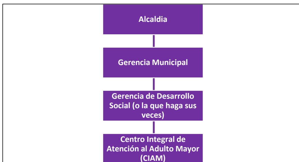
Gráfico 1: Propuesta de ubicación del CIAM

El CIAM, en el marco de lo señalado en el numeral 11.2 del Reglamento de la Ley N° 30490, Ley de la Persona Adulta Mayor, ejerce sus funciones dentro del área de desarrollo social o la que haga sus veces en el Gobierno local, según la estructura orgánica de cada municipalidad 4 .